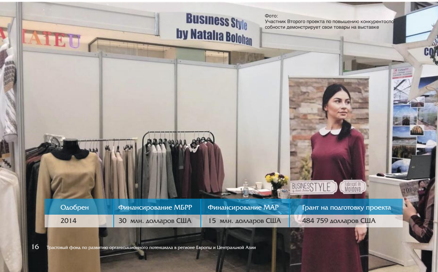
Фото: Участник Второго проекта по повышению конкурентоспособности демонстрирует свои товары на выставке

Посредством обучения, разработки проектной документации и технических отчетов грант на подготовку проекта заложил основы для успешной реализации Второго проекта по повышению конкурентоспособности. Исследование сектора малых и средних предприятий (МСП) позволило Агентству по развитию малых и средних предприятий Молдовы получить больше информации о компаниях, которым оно могло бы оказать поддержку в рамках новых или расширенных программ. За счет средств гранта было такое профинансировано исследование по вопросам конкуренции, которое стало информационной основой для Правительства при определении приоритетов реформ в этом секторе и позволило Агентству по привлечению инвестиций и продвижению экспорта разработать стратегию на 2015 год и последующий период. Рекомендации, подготовленные по результатам анализа потенциала странового агентства по частичному гарантированию кредитов позволили Агентству по развитию МСП усовершенствовать его структуру и функционирование.