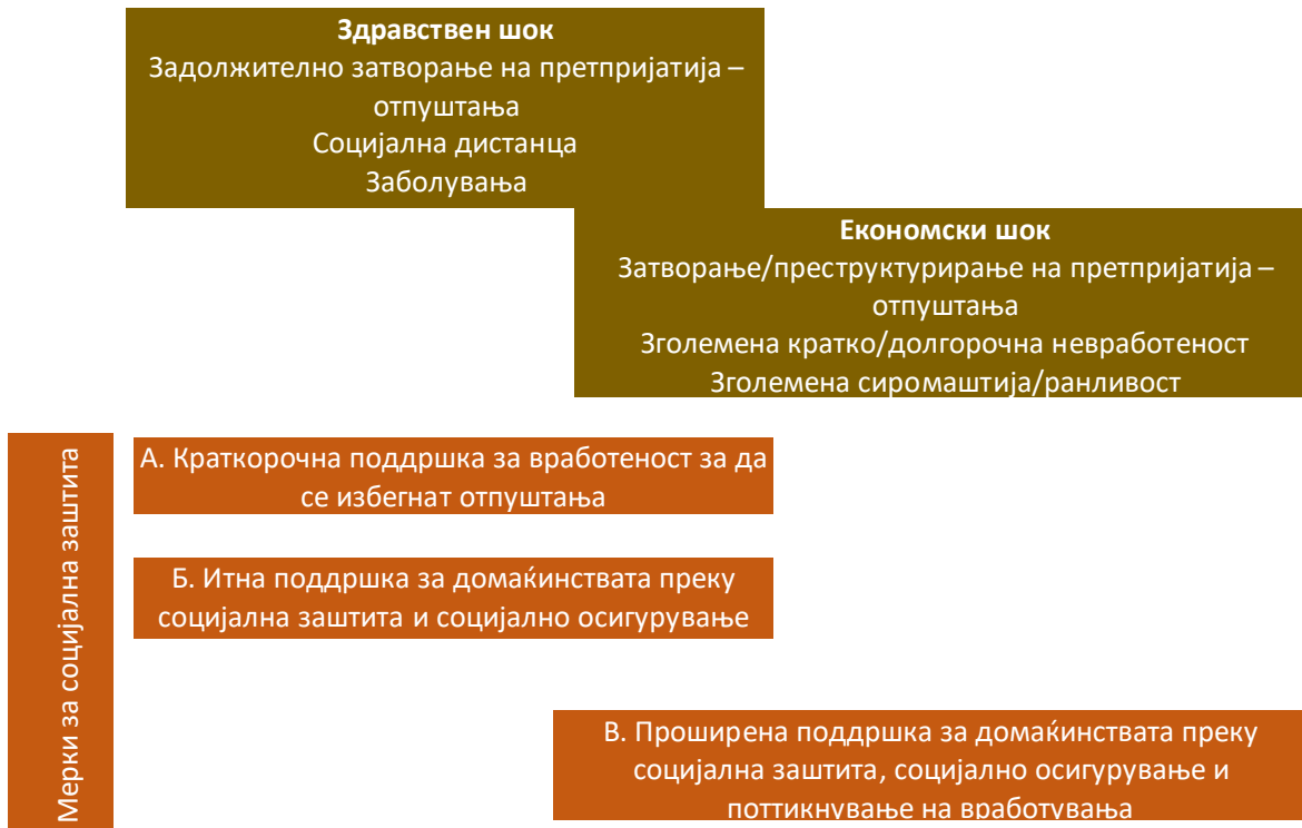
Илустрација 1: Едноставна рамка за итен одговор

Ограничувањата на економската активност наменети за заштита од пандемијата - барем оние од најдрастичен степен - ќе треба да бидат временски ограничени поради нивните значителни фискални трошоци. Но, дури и по отпуштањето на таквите мерки, економското пад може да продолжи подолго време. Карактеристиките на пазарот на трудот што се специфични за Западен Балкан може особено неповолно да влијаат врз некои домаќинства. На пример, меѓународните забрани за патувања може да влијаат врз сезонските и привремените мигранти кои наоѓале можности за работа во земји чии граници сега се затворени. Дознаките од странство - важен извор на приход за голем број домаќинства во западнобалканскиот регион - исто така можеби ќе се намалат. Сè додека економијата не закрепне, ќе има потреба од поддршка на домаќинствата кои западнале во сиромаштија или се на граница на сиромаштија, како и на невработените, преку проширени мерки за социјална заштита и социјално осигурување, и да им се помогне да најдат нови работни места преку мерки за поттикнување на вработувања. Сепак, фискалните импликации ќе бидат значителни и властите ќе треба да најдат рамнотежа помеѓу мерките за поддршка на растот и инвестициите, и поддршката на домаќинствата во рамките на одржлива фискална позиција.