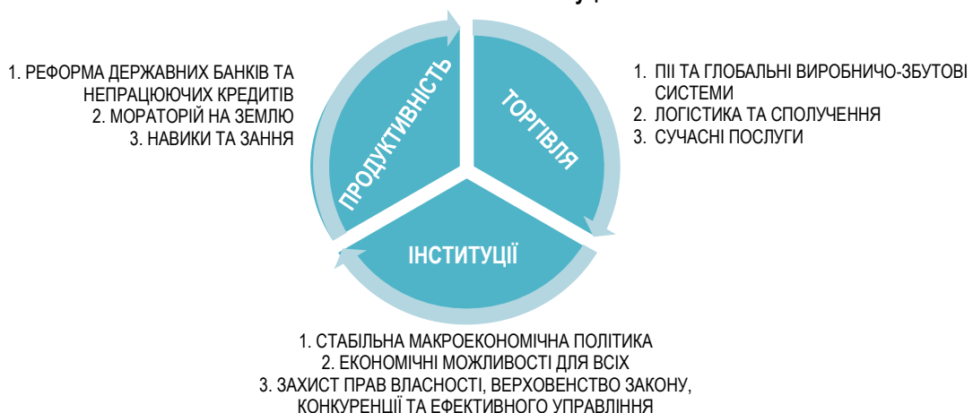
Схема 1: Пріоритетні сфери для зростання рівня продуктивності, використання зовнішніх торговельних можливостей, посилення стійкості інституцій