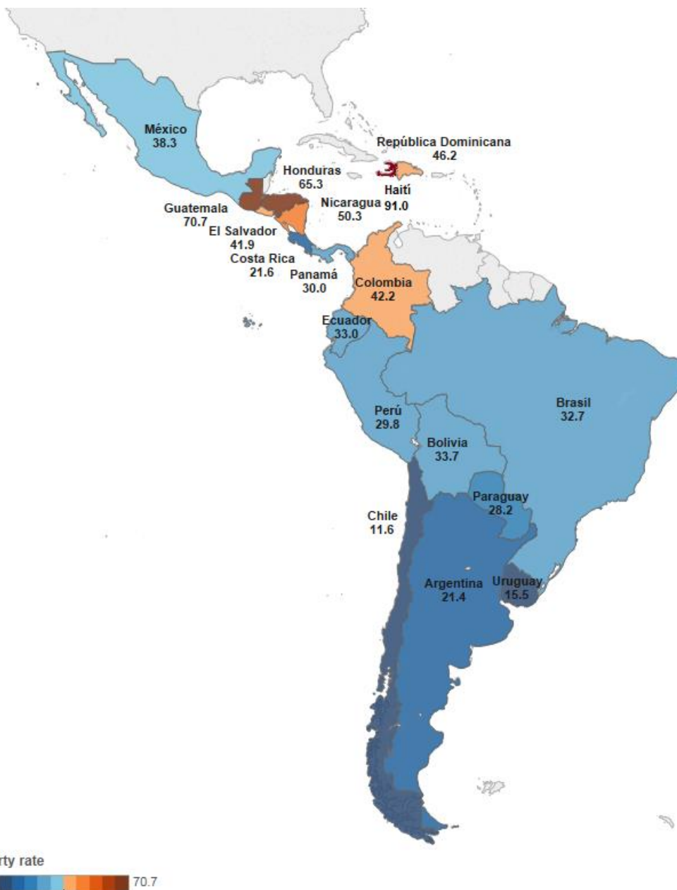
Figura 2. Las tasas de pobreza infantil (US$4 al día) son más altas en Centroamérica y el Caribe (2014)

Nota: Las tabulaciones se basan en SEDLAC (CEDLAS y el Banco Mundial). Nota: Los niños se definen como aquellos de 14 años y menores. Estas tasas de pobreza se basan en información armonizada procedente de 18 países, usando la información del año más cercano; en los siguientes casos, la información no es del 2014: Chile y República Dominicana (2013) y Haití (2012).