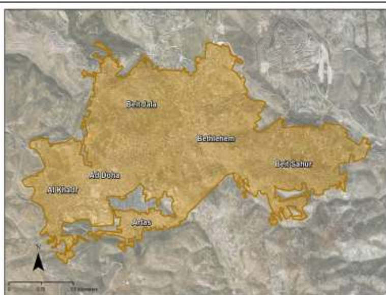
Moving towards a metropolitan approach מעבר לגישה מטרופוליטנית

במקרים רבים זוהי הפעם הראשונה שבה מוכנות הרשויות לחבר את יוזמות הפיתוח שלהן עם אלה של שכניהן.