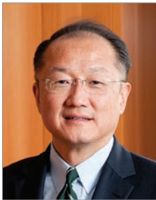
Jim Yong Kim Président, Banque mondiale

Pour le Groupe de la Banque mondiale, la lutte contre la fraude et la corruption est une mission capitale. Elle est essentielle au travail que nous accomplissons chaque jour pour éliminer la pauvreté et étendre la prospérité, puisqu'elle garantit que nos efforts portent leurs fruits et qu'ils amènent des transformations durables par une bonne gouvernance et des institutions cohérentes. C'est un grand honneur pour moi de rejoindre le Groupe de la Banque mondiale à un moment où des mesures énergiques de lutte contre la corruption ont été mises en place dans toutes nos activités et à chaque niveau — depuis l'échelon local jusqu'au niveau mondial.