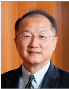
Jim Yong Kim Presidente, Banco Mundial

Para o Grupo Banco Mundial, combater a fraude e a corrupção é uma responsabilidade vital. Em nosso trabalho de erradicação da pobreza e expansão da prosperidade, é fundamental assegurar que nossos esforços sejam eficazes e que adotemos uma mudança sustentável por meio da boa governança e de instituições sólidas. É para mim uma honra começar a trabalhar no Grupo Banco Mundial em um momento em que as iniciativas de combate à corrupção se tornaram parte integral de nossas operações em todos os níveis — desde o local até o global.